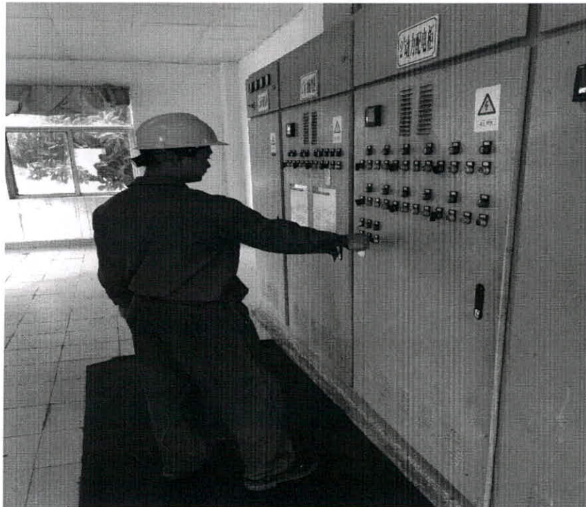
机修人员调整提升泵功率